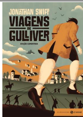
LIVRO: Viagens de Gulliver AUTOR: Jonathan Swift EDITORA: Pequena Zahar