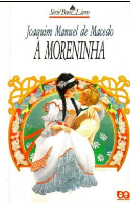
LIVRO: A Moreninha AUTORA: Joaquim Manoel de Macedo EDITORA: Scipione