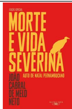
LIVRO: Morte e Vida Severina AUTOR: João Cabral de Melo Neto EDITORA: Alfaguarda